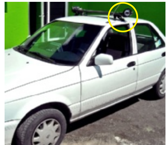
➤ El centro de monitoreo también cuenta con unidades civiles con cámaras para rastrear autos robados a través de las placas.

sonal de la Policía Estatal y del área de Inteligencia, a manera de que en cuanto nos llegue la información de un robo y se detecte, movilizar unidades, armar operativos y detener a los presuntos delincuentes", explicó García Benavente.